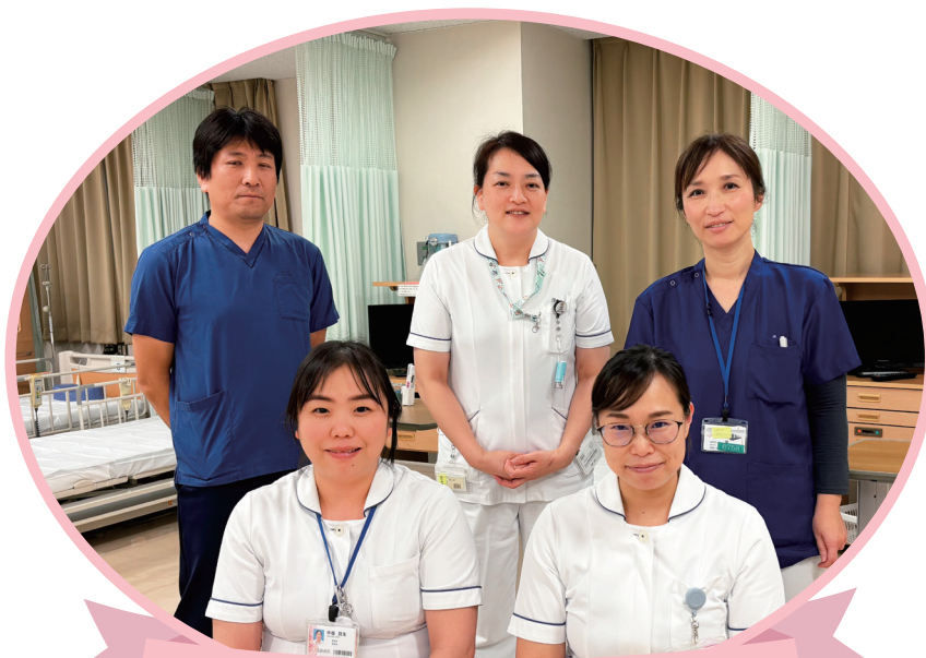
化学療法センターの薬剤師と看護師

がんに対する治療薬の種類は様々であり、1人1人副作用の種類や症状は異なります。以前は、これらをコントロールするために入院での治療が必須でしたが、吐き気などの副作用に対するお薬も進歩し、多くのがん薬物治療を外来通院で行うことが可能となりました。そのため、化学療法センターでは、体調管理をご自宅で患者さん自身や家族が行えるように、その人の生活スタイルを考慮しながらケア方法などを提案しています。治療中心の生活ではなく、治療と仕事の両立など何気ない日常の時間を大事にして、治療が継続できるように往診医や訪問看護とも連携しています。